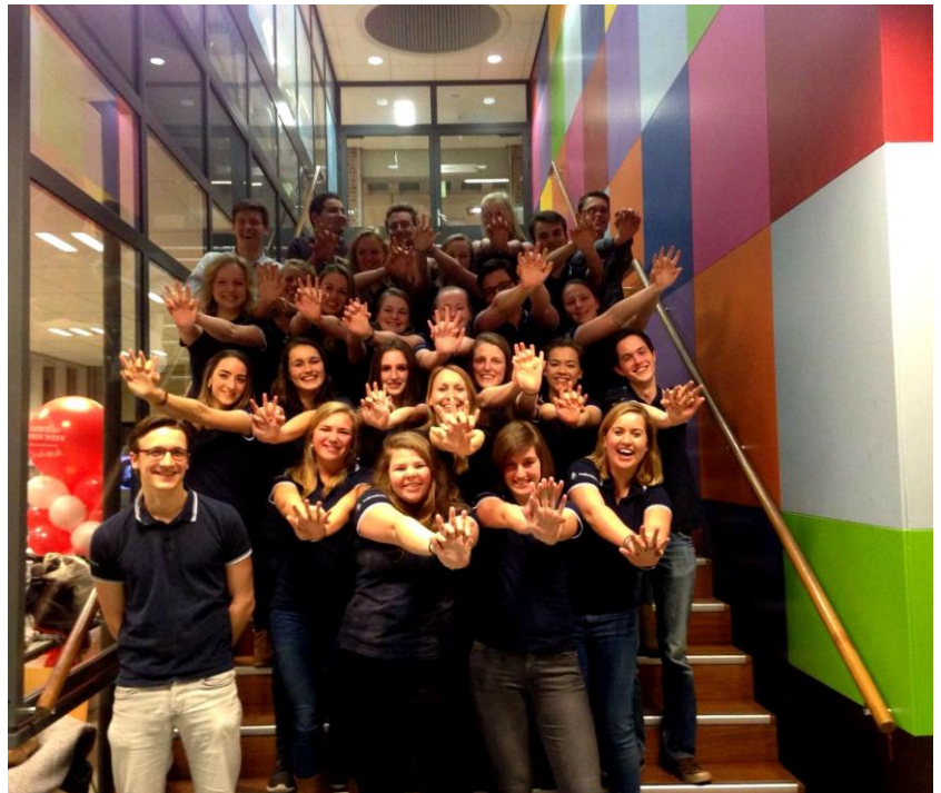
Een groot deel van onze instructeurspoule met het bestuur. De foto is genomen op één van de gezellige instructeursavonden die het afgelopen jaar georganiseerd zijn.

De instructeurspoule kwam hiermee op 23 in totaal. Ook dit is conform beleidsplan.